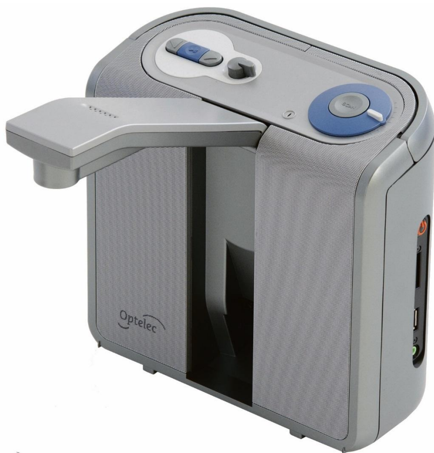
CLEARREADER+ generation 2 20250409